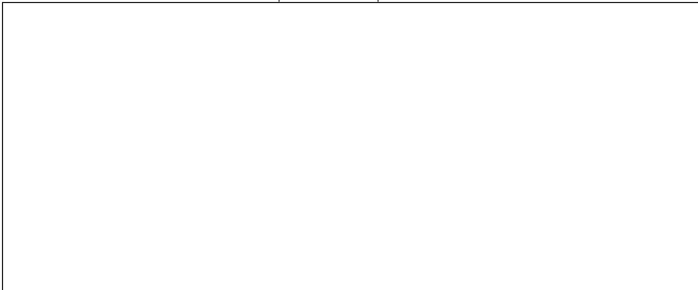
Схема расположения захоронения